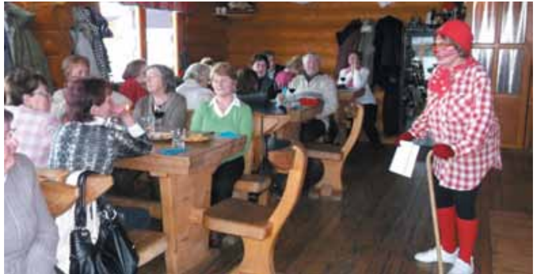
Náš SENIORklub na návšteve v Kolibe TATRY počas kultúrneho programu

Vždy keď končí kalendárny rok je čas zastáť a obzrieť sa dozadu. Zaspomínať si na to, čo rok priniesol, čo z našich predsavzatí sme splnili a na ktoré sme nemali čas, alebo sily. Dňa 12. 12. 2013 sa zišlo 29 členov SK na výročnej členskej schôdzi, aby zbilancovali už siedmy rok činnosti SK. Posedenie bolo v peknom prostredí Koliby Tatry, vianočne vyzdobenej, nechýbal ani vianočný stromček a príjemnú atmosféru dotváral v krbe pukotajúci ohnäk a veľmi milá, ústretová obsluha.