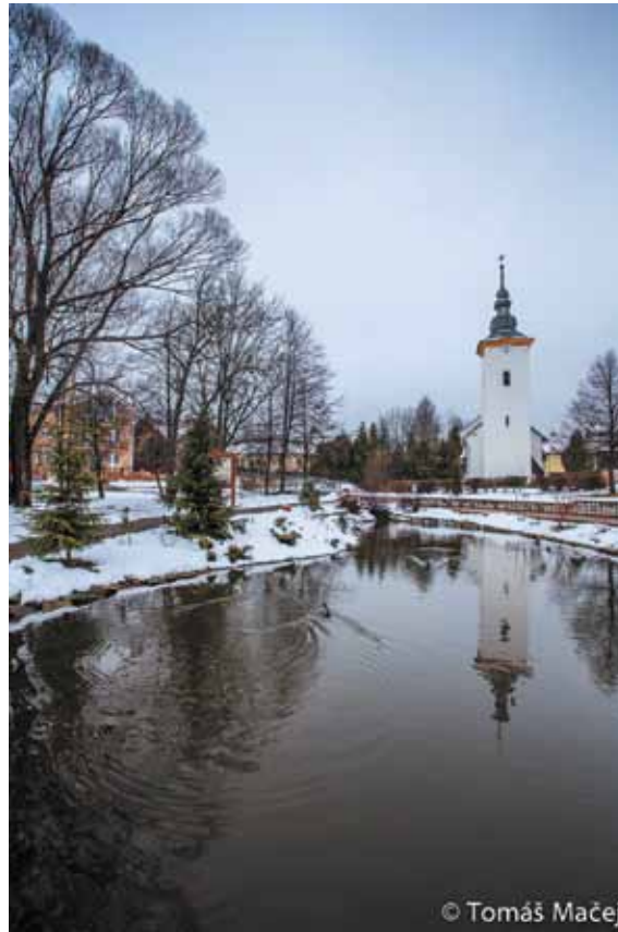
Do redakcie nám prišla zimná fotografia centra našej obce, čomu sa veľmi tešíme a za čo autrovi ďakujeme

predstavili Oblastnej organizácii cestovného ruchu Vysoké Tatry – Podhorie kalendár podujatí, Novolesnianskeho kultúrneho leta 2014“.