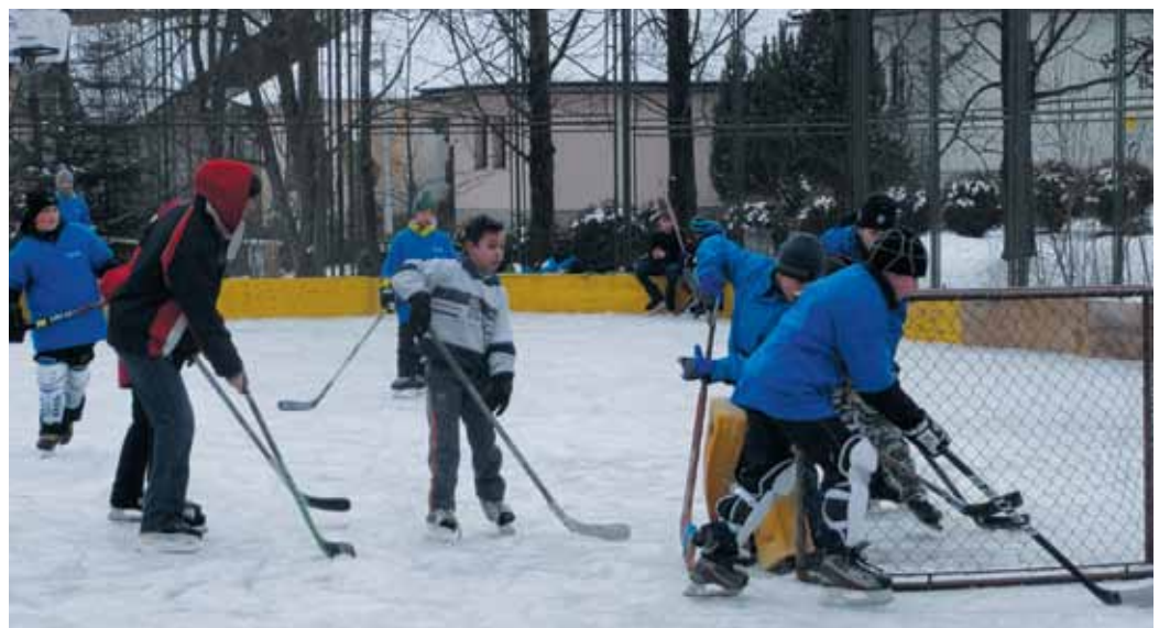
Druhý ročník Hokejového turnaja o Pohár starostu obce Nová Lesná