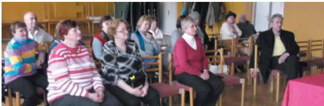
Členovia SENIORklubu so starostom obce