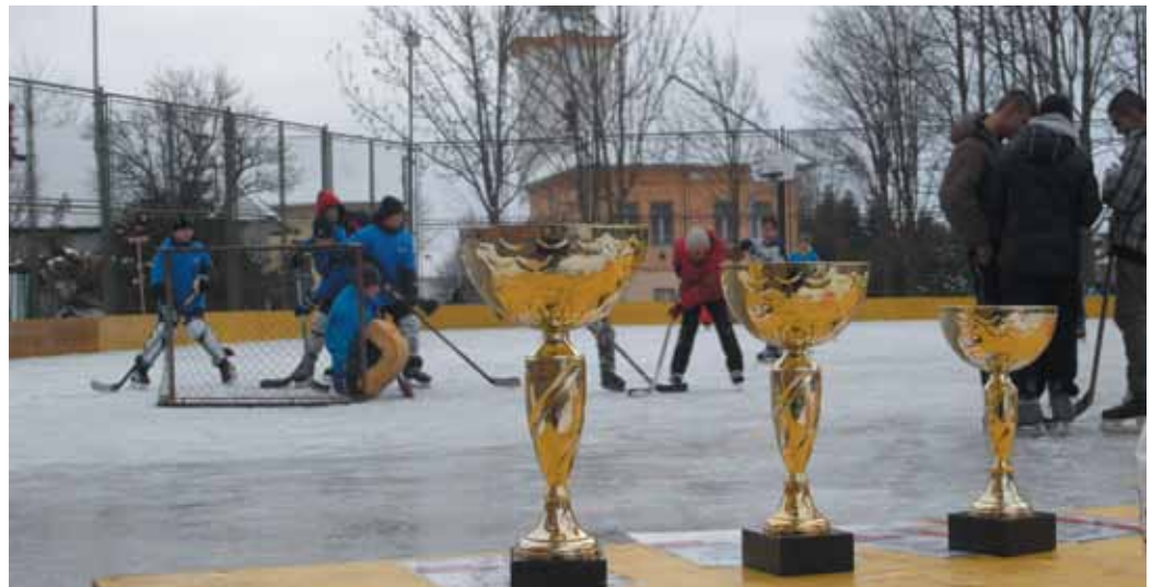
Druhý ročník Hokejového turnaja o Pohár starostu obce Nová Lesná