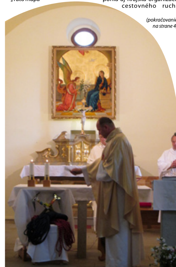
Svätenie lána a čakana v rímskokatolíckom kostole