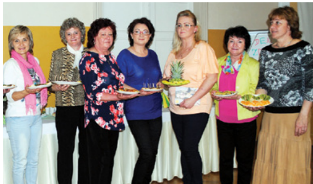
Deň zdravia 2014

spolupráci. Každý z nich mal tiež priestor na prezentáciu svojej obce, a tak sa okolo 200 obyvateľov týchto spriatelenej obcí malo možnosť dozvedieť, čo je pre tú-ktorú obec typické, špecifické, čo môže obec navštívnikom ponúknuť, akú má históriu či tradície. Jednotlivé obce sa prezentovali tiež výstavkami. Novolesňania tu predstavili