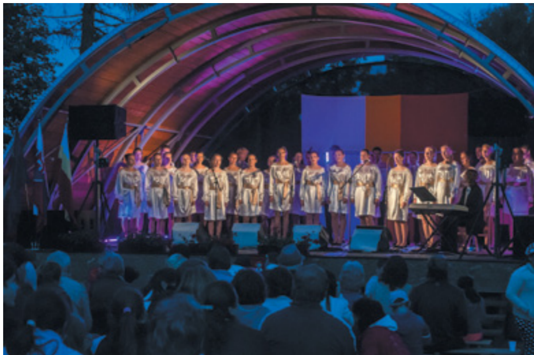
Bartolomejský deň 2014