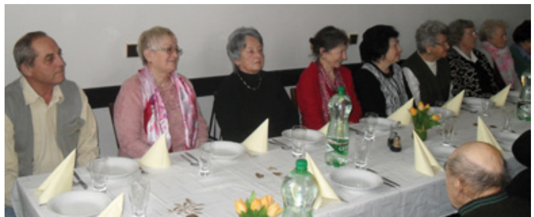
Jubilanti - v stredu 10. 12. 2014 v priestoroch G-baru boli prijatí starostom obce tohtoroční jubilanti