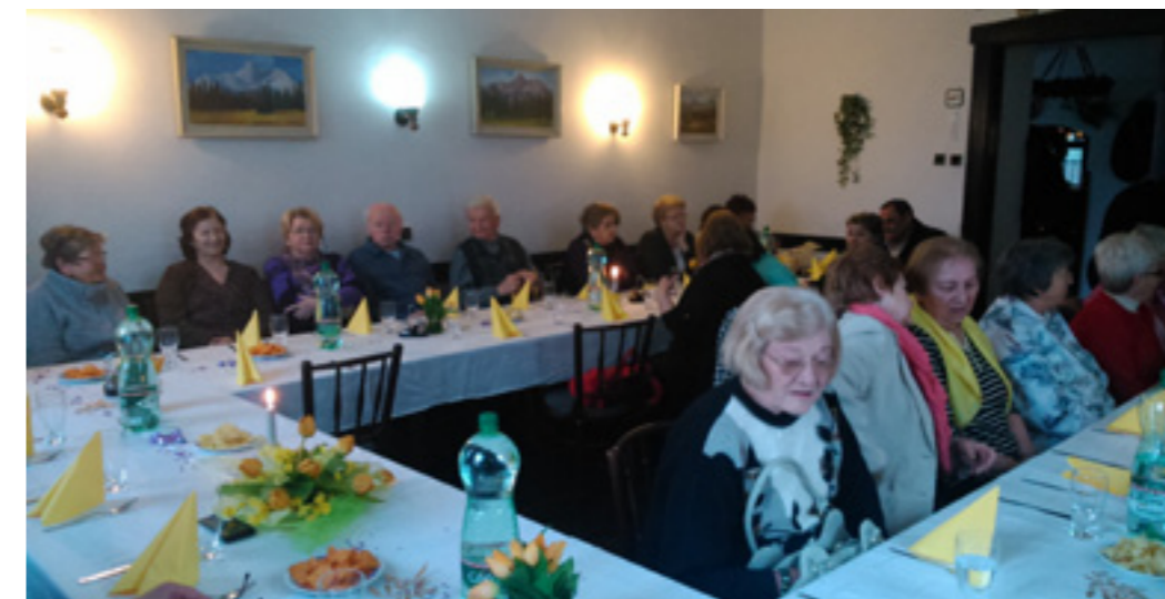
Horský záchranár s lavínovým psom a vysokohorský nosič