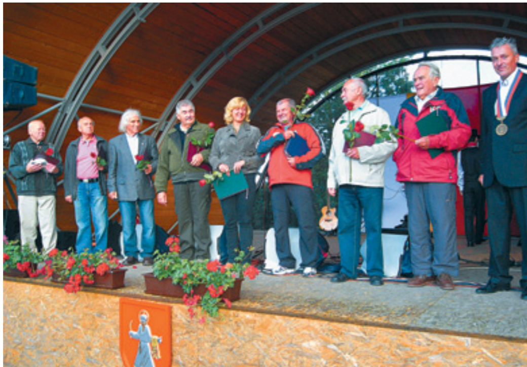
Cena starostu 2014