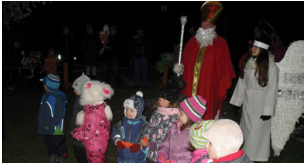
Novolesnianske deti s Mikulášom a anjelom v centre obce