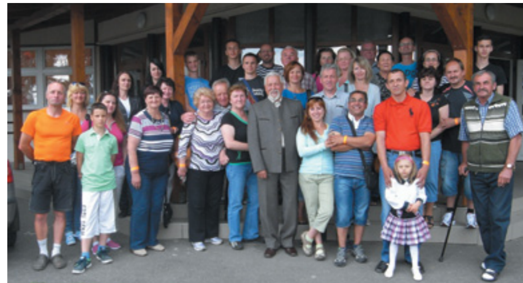
Naši občania na návšteve v družobnej obci Hidasnémeti

Pri ukončení funkčného obdobia je zodpovedné zhodnotiť ho. Hodnotenie som rozdelil na viacero oblastí, v ktorých sme realizovali nasledujúce činnosti: