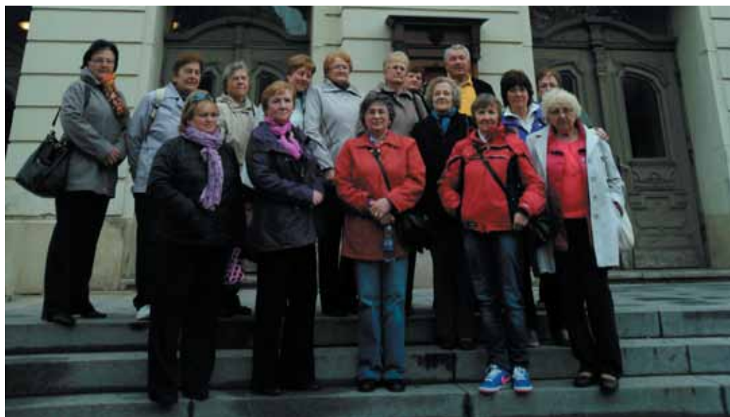
Seniori pred Štátnym divadlom v Košiciach