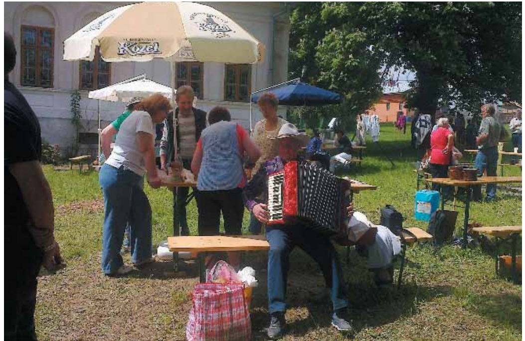
Členovia ZO JDS pri varení gulášu