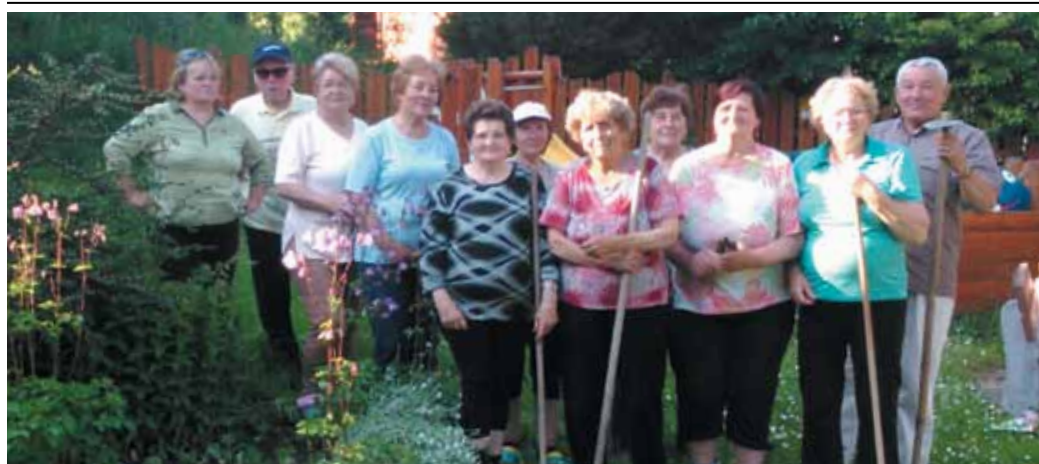
Seniori na brigáde pri SK