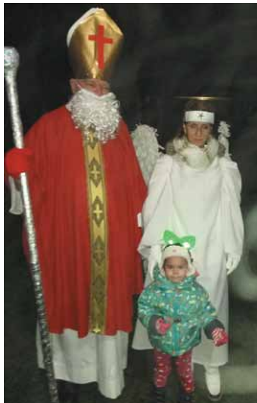
V pondelok 7. decembra v dopoludňajších hodinách navštívil detičky z materskej školy Mikuláš, ktorý im priniesol sladké prekvapenie. Vo večerných hodinách sme v centre obce privítali Mikuláša spoločne s anjelom, ktorí odovzdali všetkým dobrým deťom balíčky so sladkosťami.