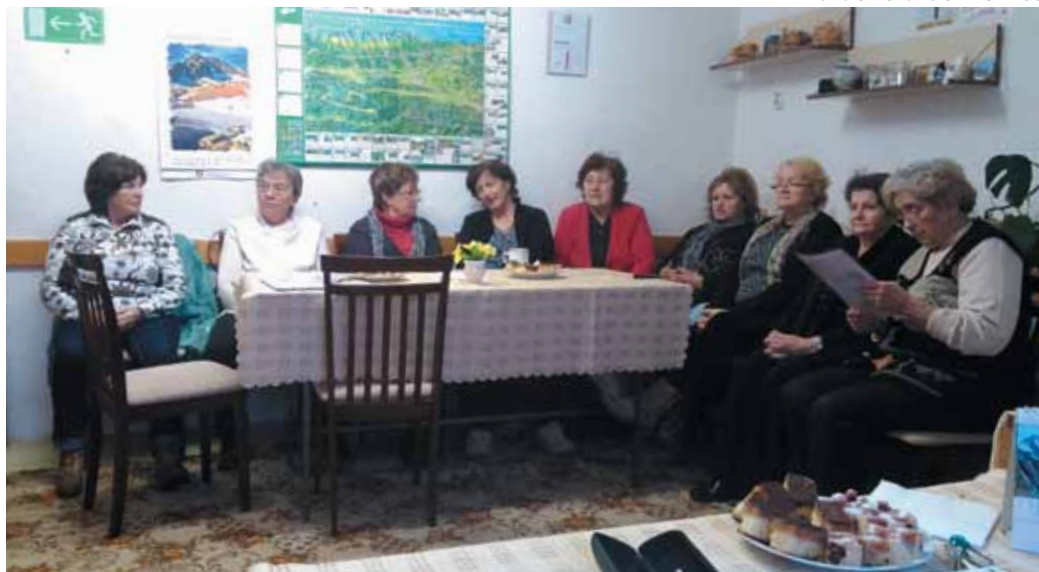
Novembrové stretnutie členov SENIORklubu - prednáška na zdravotnú tému