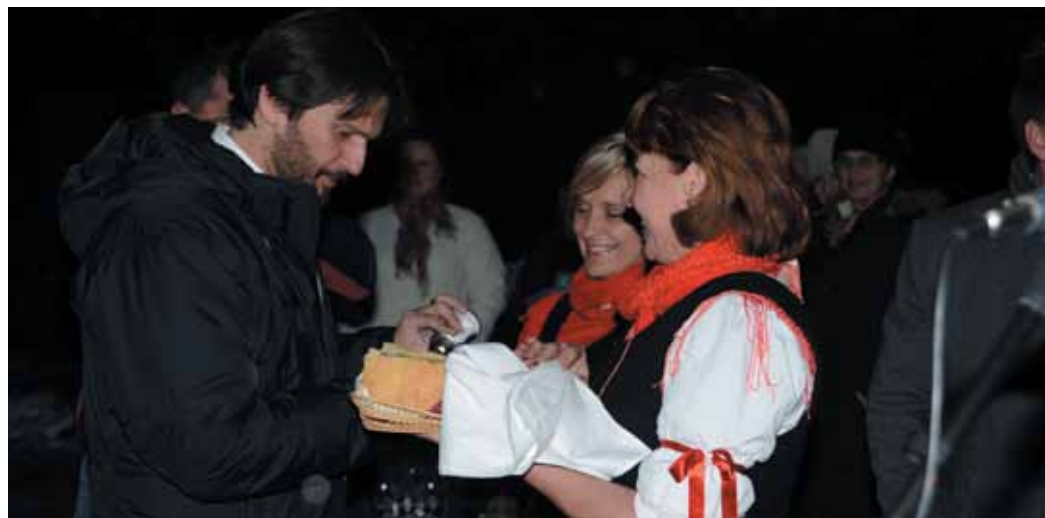
Slávnostné privítanie podpredsedu vlády a ministra vnútra SR R. Kaliňáka v obci Nová Lesná.