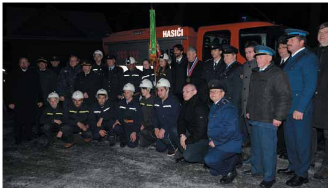
Odovzdávanie nového hasičského auta pre členov DHZ Nová Lesná